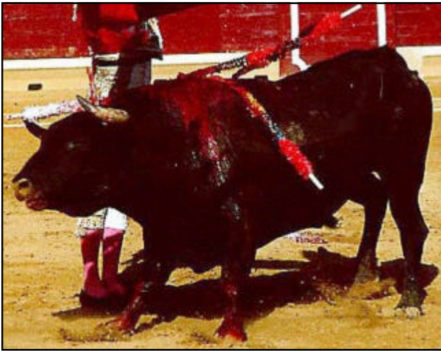
“Que valor, señores”

El torero hace entonces las suertes con el capote, rojo no porque este color excite al animal, que es ciego a los colores, sino para que no se note la sangre que salpica. En otras ocasiones, se torea a caballo. El rejoneador coloca las banderillas en el toro, y al final, el toro será muerto por el rejoneador, ya sea a pie o a caballo, usando una especie de lanza llamada “rejoneador de la muerte.” La suerte de los caballos utilizados es similar a la de los caballos de los picadores.