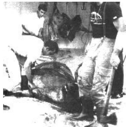
El toro llega para ser destazado