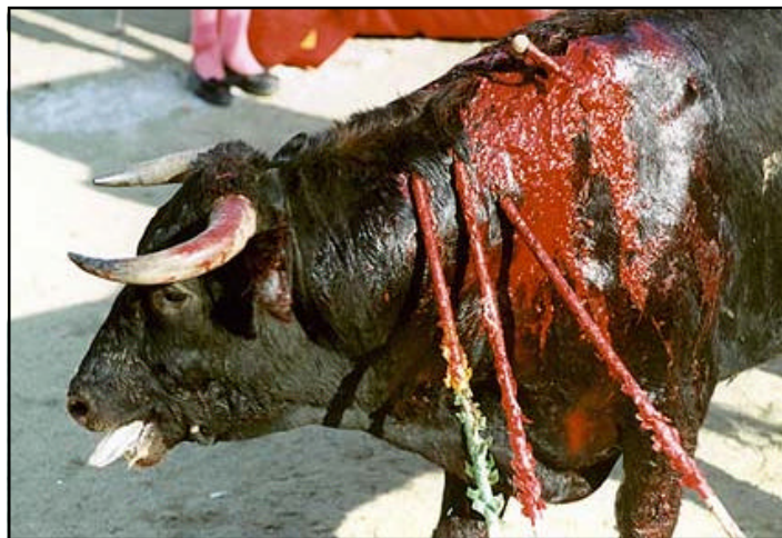
Lección bien aprendida

Aunque el toreo era tradicionalmente un espectáculo reservado para toreros adultos, con cada vez mayor frecuencia se sabe de toreros menores de edad. Destaca el caso de Julián López Escobar “El Juli,” llamado prodigio por aquellos que gustan presenciar la sangrienta tortura del toro. Ahora, en España, niños casi siempre pobres, atraídos por el prestigio y dinero fáciles, son enrolados, desde los ocho años en escuelas de toreo. Entre las diferentes actividades que realizan en esos lugares, visitan con regularidad rastros para practicar sus técnicas con la daga y la espada. Todas estas escuelas cuentan, en mayor o menor grado, con subsidios aportados por los contribuyentes. ☆