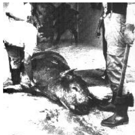
Al clavarle el cuchillo, mueve la cabeza. Esta vivo