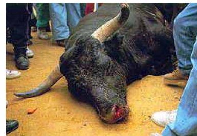
Compartiendo la diversión

En México, las “pamplonadas” realizadas en distintas partes del país, sin ton ni son y de acuerdo a los caprichos de moda, terminan con frecuencia en episodios similares. A los toros se les apuñala, se les prende fuego con gasolina, se les cuelga de los cuernos hasta que se rompen, y finalmente, cuando el animal ya no puede huir, lo matan a patadas.