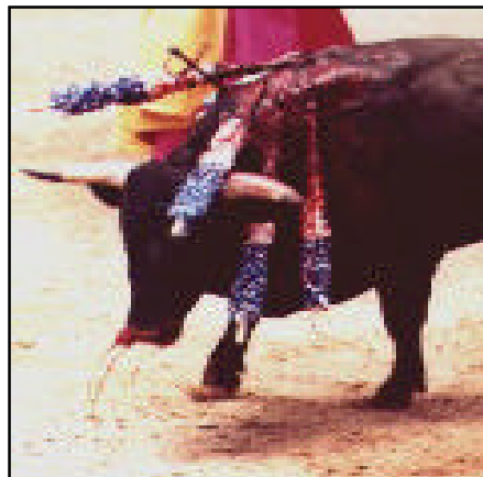
El toro disfruta la corrida

el picador, con pericia, abre en el toro un boquete enorme, que en promedio alcanza 40 centímetros de profundidad, girando con saña su instrumento de tortura, y va perforando y despedazando los órganos internos del animal. La hemorragia así causada provoca un torrente de sangre, que se vierte abundantemente no sólo a través de las heridas externas, sino casi siempre también por la boca.