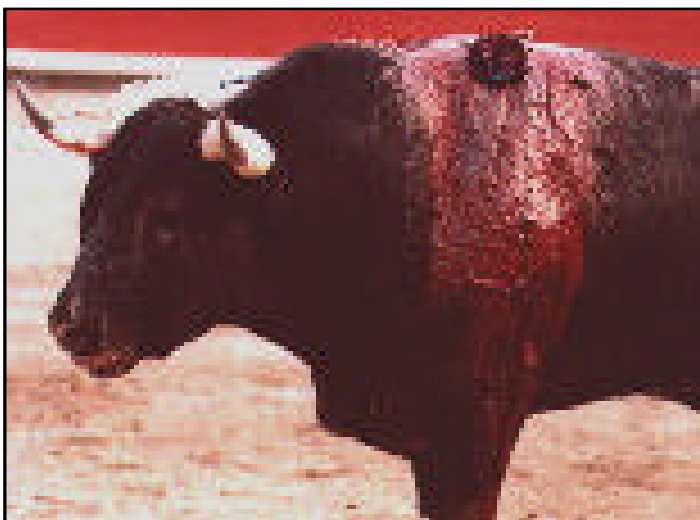
Empieza la diversión

La pica es, por disposición legal, de acero cortante y afilado, y está rematada por un arpón de 10 cm, seguido por una cruceta o varias; la cruceta es un disco que casi siempre penetra profundamente en el cuerpo del animal; ➤K 2