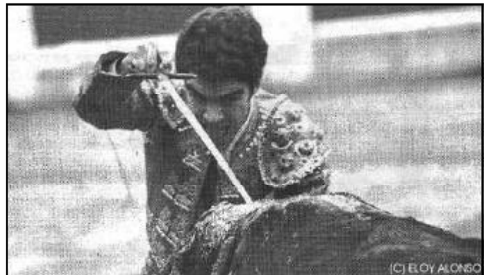
Se acerca el momento de la victoria